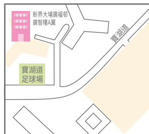
賽馬會恆悅坊(大埔) 新界大埔廣福邨 廣智樓A翼地下101-108室 電話：2651 8132