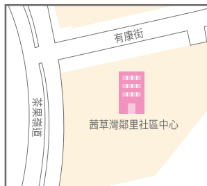
賽馬會恆健坊(觀塘南) 九龍觀塘茶果嶺道81號茜草灣 鄰里社區中心四樓 電話：2346 3798